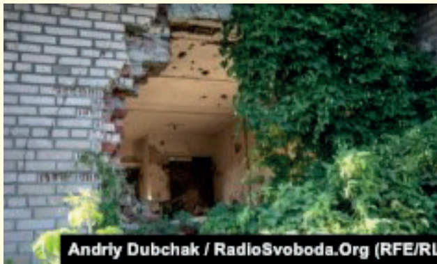
Будівля, зруйнована внаслідок обстрілу, Опитне (Донецька область)

«Цей підхід допоміг знизити кількість смертей і поранень серед цивільних – саме завдяки аналізу того, що відбувалося, – розповідає