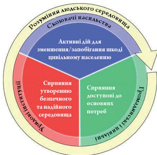
Структура ЗЦН у НАТО

Актуальність проблеми захисту цивільного населення спонукала НАТО сформулювати завдання ЗЦН та структури їх реалізації.