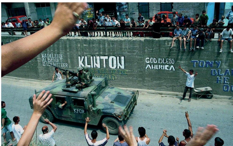
Албанці вітають сили КФОР після проведення операції НАТО “Союзна сила”