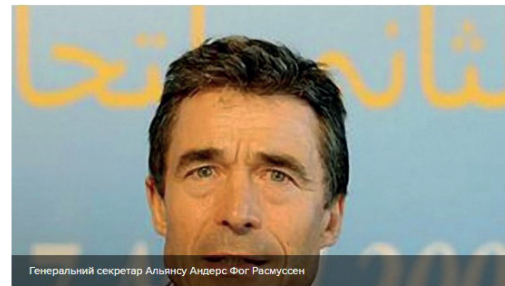
Генеральний секретар Альянсу Андерс Фог Расмуссен

Генеральний секретар Альянсу Андерс Фог Расмуссен заявив сьогодні, що НАТО не має наміру припинити операцію "Об'єднаний захисник" у Лівії.